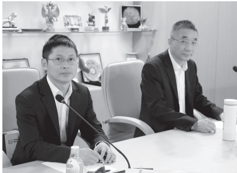
Гостей из Китая интересовала правозащитная деятельность профсоюза

Делегация из Китайской Народной Республики 17 сентября посетила центральный офис Общероссийского Профсоюза образования. Визит был инициирован китайской стороной и связан с программой повышения квалификации, которую проходила группа чиновников Комитета трудовых ресурсов и социальной защиты провинции Цзянси - одной из 32 провинций Поднебесной.