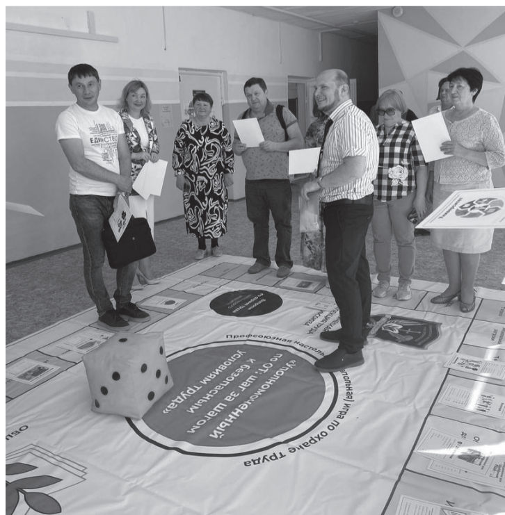
Так выглядит настольный вариант игры

- Игра помогает использовать инновационные решения в обучении по охране труда - мотивировать на безопасность персонал образовательной организации, закреплять знания в нестандартной форме, развивать компетенции. Замечательно, что не требуется выделения больших денежных средств из бюджета образовательной организации.