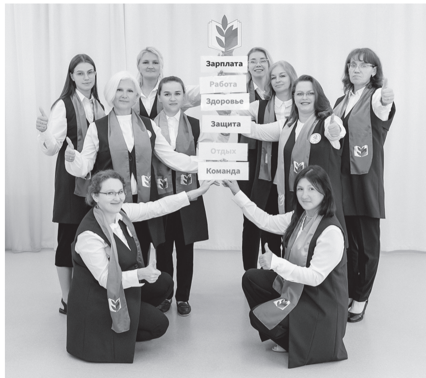
Команда детского сада №67

НАША ПЕРВИЧКА ОТМЕЧАЕТ ПЕРВОЕ ДЕСЯТИЛЕТИЕ