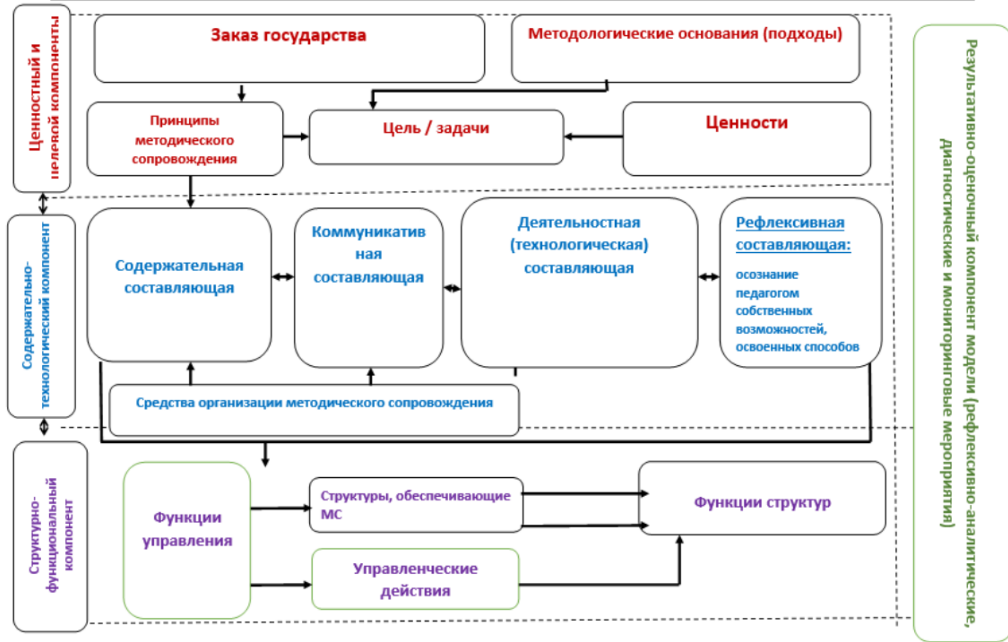
Схема модели методического сопровождения педагога по формированию функциональной грамотности обучающихся на муниципальном уровне